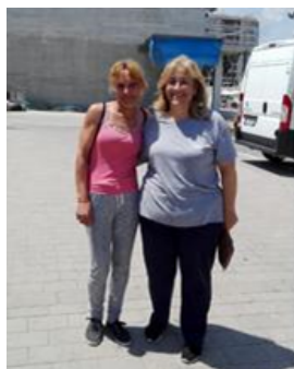
Ilustración 1: Pescadoras llegando de faena

Las principales funciones de la mujer en el puerto de Gandía son: la confección y reparación de artes de pesca, descarga y clasificación de pescado, abastecimiento de productos, transformación, empaquetado y comercialización del pescado y gestión. En el puerto de Gandía las mujeres que embarcan y van a pescar son solo cuatro. Esta cofradía todavía no cuenta con un colectivo de mujeres pescadoras organizadas formalmente, las pescadoras, rederas y esposas de los pescadores no se reúnen de manera formal a discutir temas trascendentes de la actividad y a lo largo de estos años aún no han reconocido el valor que tiene su trabajo dentro de la cofradía.