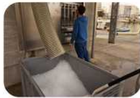
Depósito de hielo