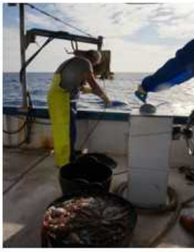
Pesca Pulpo con Cadufos