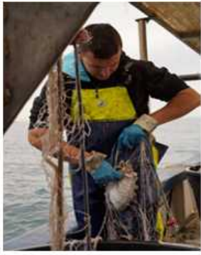
Pesca Sepia con trasmallo.